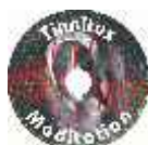
CD εξειδικευμένων ήχων για χαλάρωση ειδικά για τις δικές σας εμβοές