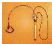
Soft Laser Tinnitool

Η ζωή των ατόμων με εμβοές μπορεί να βελτιωθεί με τις σύγχρονες μεθόδους θεραπείας και ανακούφισης . Στην earcare θα βρείτε εκτός από τη μέθοδο SoftLaser Tinnitool, μια μεγάλη συλλογή από βοηθήματα ανακούφισης και χαλάρωσης για καλύτερη καθημερινή ζωή και πιο εύκολο ύπνο .