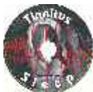
CD εξειδικευμένων ήχων για καλύτερο ύπνο ειδικά για τις δικές σας εμβοές