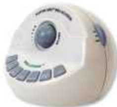
Συσκευή παραγωγής ήχων ανακούφισης